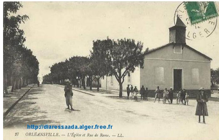
La première église construite à ORLEANSVILLE.

(Source : D'après L. CASTERA in "Algéria" Noël 1934.