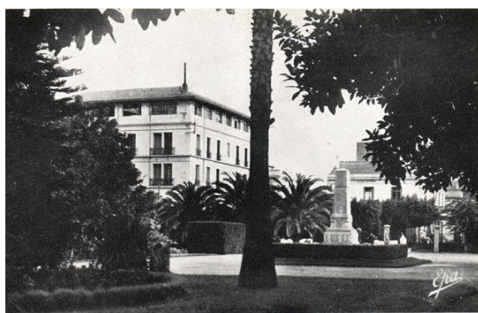
Site J. TORRES

Le relevé n°54658 mentionne les noms de 238 soldats « Morts pour la France » au titre la guerre 1914/1918, à savoir :