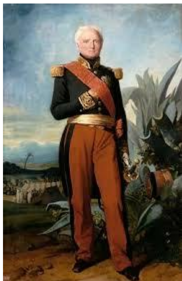
Thomas BUGEAUD (1784/1849)

Le 23 avril 1843 la colonne du général GENTIL, comprenant des troupes de la division d'Oran et celle du Maréchal BUGEAUD venant d'Alger opéraient leur jonction dans la vallée du CHELIF à peu près à égale distance de Miliana et de Mostaganem. Le plan du Maréchal consistait à dominer la plaine et à créer au centre un établissement qui communiquerait avec un port voisin.