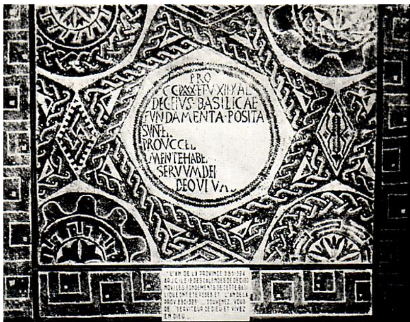
L'inscription donnant la date de la fondation de la Basilique

La ville abritait la plus ancienne église en Afrique inaugurée en 426 par Saint REPARATUS, décédé en 475.