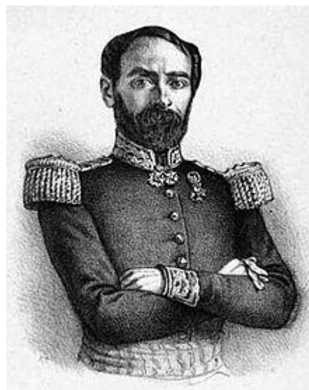
Eugène CAVAIGNAC (1802/1857)