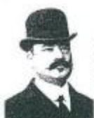
Portrait de l'ancien Paul

suivirent le cercueil jusqu'à la gare d'Alger. Les obsèques eurent lieu à Orléansville et toute la population de la ville et des environs y assista.