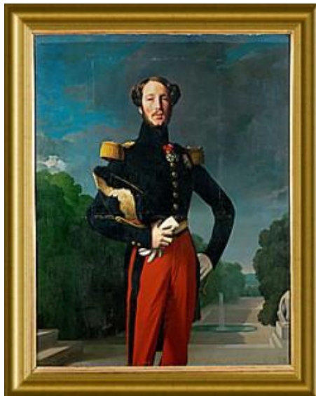
Ferdinand Philippe d'Orléans (1810/1842)